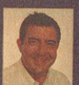
Salvador Garcia / Ovidio Penitaver / Precio: 460 €

PROVOCANDO EL CAMBIO EN LOS EQUIPOS Y SISTEMAS ORGANIZATIVOS